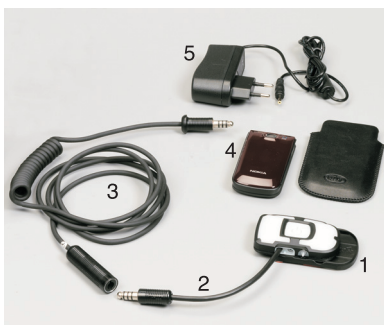
Slitta di supporto a sgancio rapido Support slide with quick release